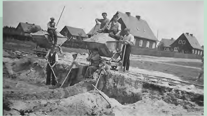
Baugrubenaushub für die Häuser des 3. Bauabschnitts an der Schenkendorfstraße, 1939

Eine Posterausstellung über die Holzhaussiedlung in Neu-Särichen war bisher ausschließlich zum Holzhausfest zu sehen und es haben an diesem Tag auch nicht alle Interessierten geschafft, sie sich anzuschauen. Das Museum Niesky bietet nun die Gelegenheit, dies in aller Ruhe tun zu können. Seit dem 2. Dezember kann die Ausstellung in den Räumen des Johann-Raschke-Hauses angesehen werden. Die Präsentation endet voraussichtlich am 9. März 2025.