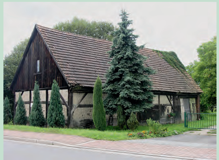
Die denkmalgeschützte Fachwerkscheune in Stannewisch sucht einen neuen Standort